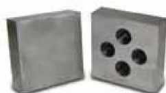
Ножи с восемью режущими кромками

Станок P-40 показал себя с самой хорошей стороны даже в самых суровых условиях эксплуатации. Благодаря своей мобильности, высоким показателям производительности и надежности, станок наиболее популярен в своем классе.