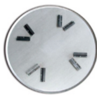
Затирачный диск с брекетоным креплением Ø 900 мм